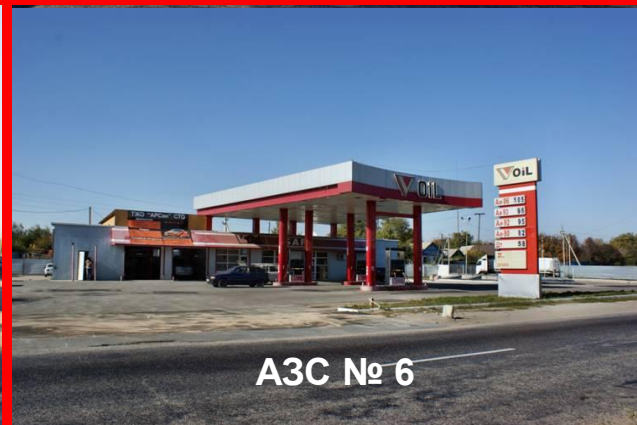
АЗС № 6