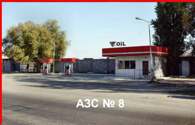
АЗС № 8