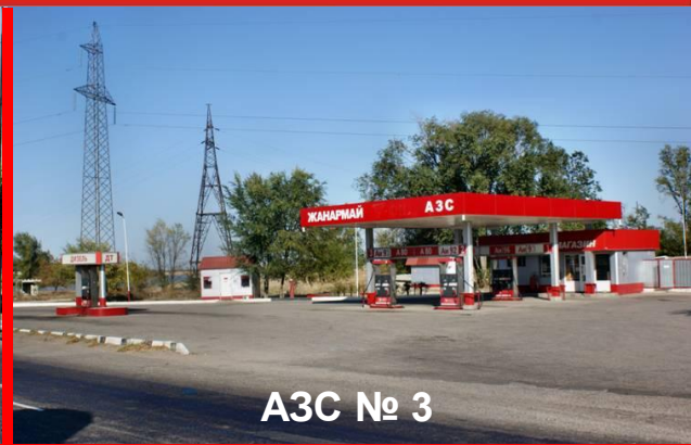
АЗС № 3