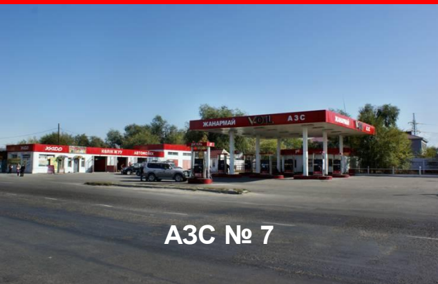
АЗС № 7