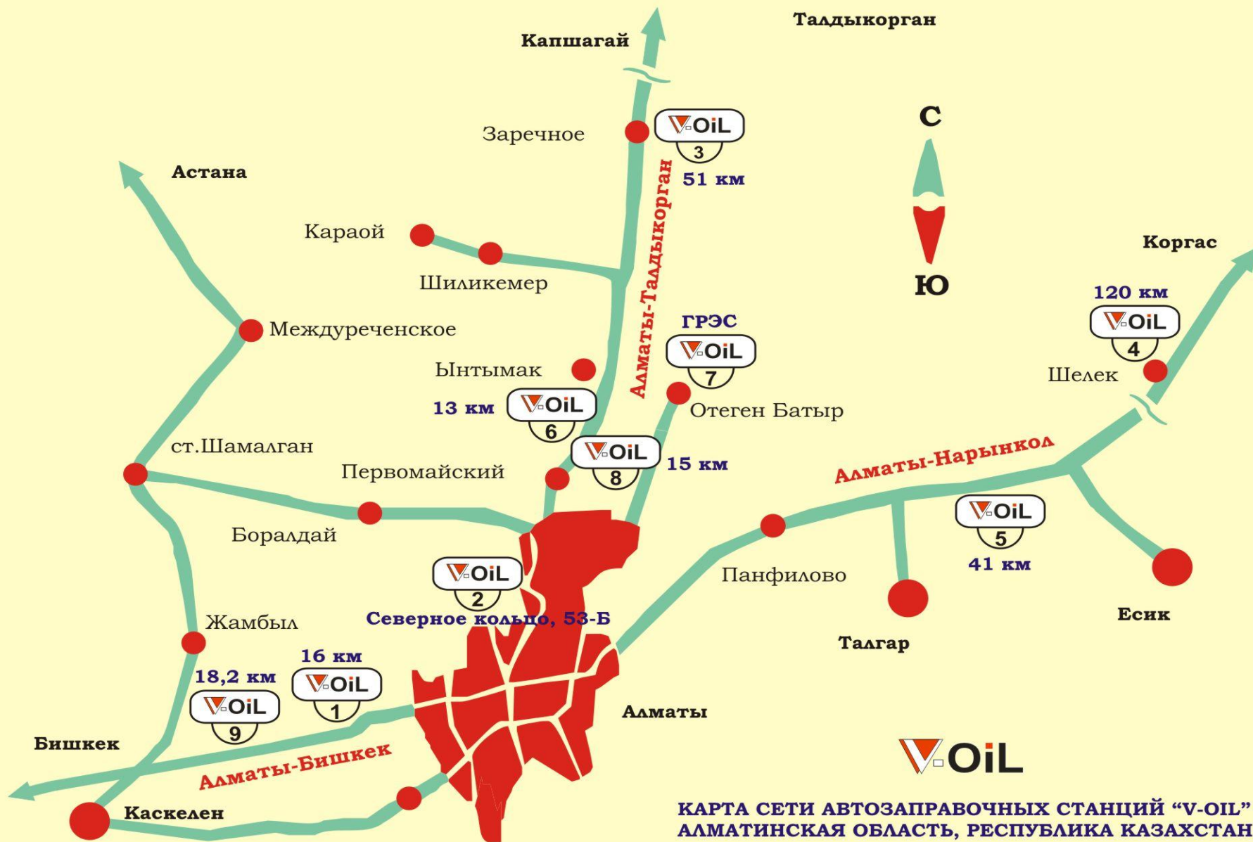
КАРТА СЕТИ АВТОЗАПРАВОЧНЫХ СТАНЦИЙ "V-OIL" АЛМАТИНСКАЯ ОБЛАСТЬ, РЕСПУБЛИКА КАЗАХСТАН