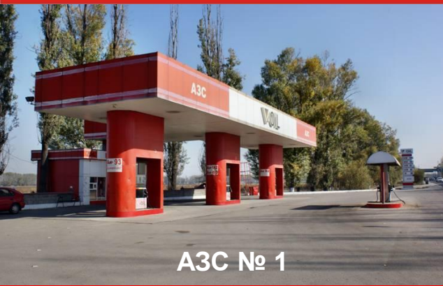
АЗС № 1