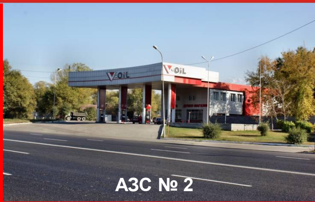
АЗС № 2