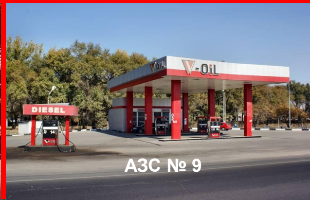
АЗС № 9