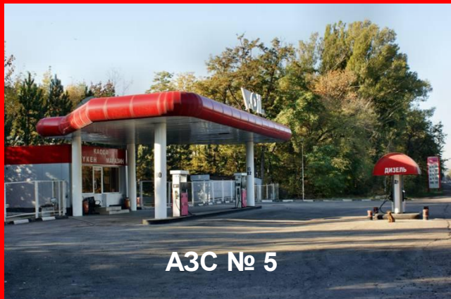
АЗС № 5