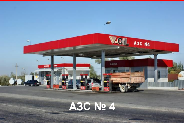
АЗС № 4